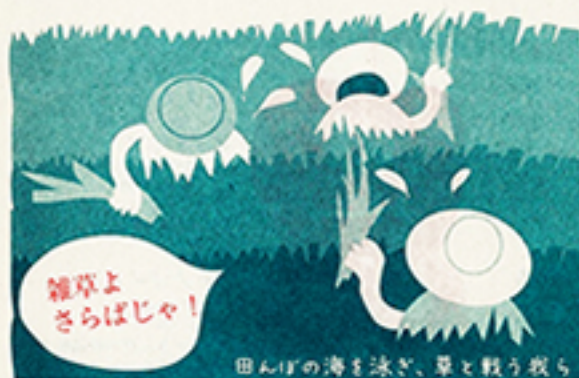
田んぼの海を泳ぎ、草と戦う我ら

※天候不順などの影響で万一お米に病気・虫がついた場合には農産物の検査で農業を使う場合があります。